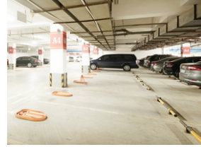
Genel alan park yönetimi