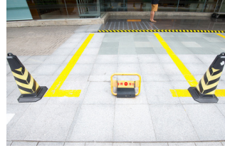
Özel otopark yönetimi