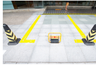
Kişiyi özel park yönetiminde